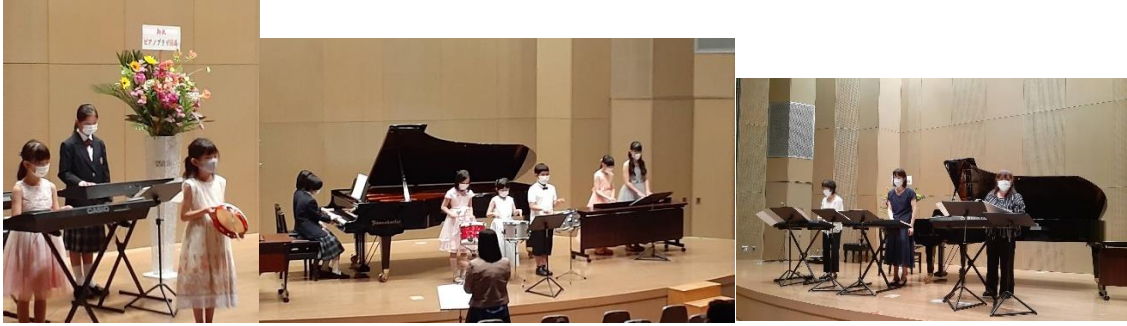
📷お写真を提供ありがとうございました。